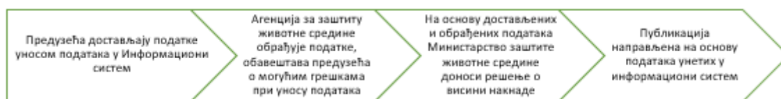
Слика 1. Ток достављања и обраде података

У циљу достизања националних циљева и у 2025. години, као и у претходном периоду потребно је и даље радити на подизању нивоа свести становништва и капацитета правних лица, још интензивнијем укључивању јавно комуналних предузећа у имплементацију система управљања амбалажом и амбалажним отпадом, као и појачати инспекцијски надзор предузећа.