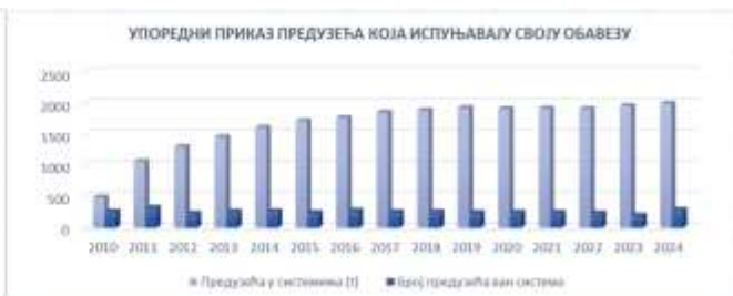
Слика 5. Упоредни приказ предузећа која испуњавају своју обавезу

Анализом достављених података о количинама амбалаже пласиране на тржиште Републике Србије може се закључити: