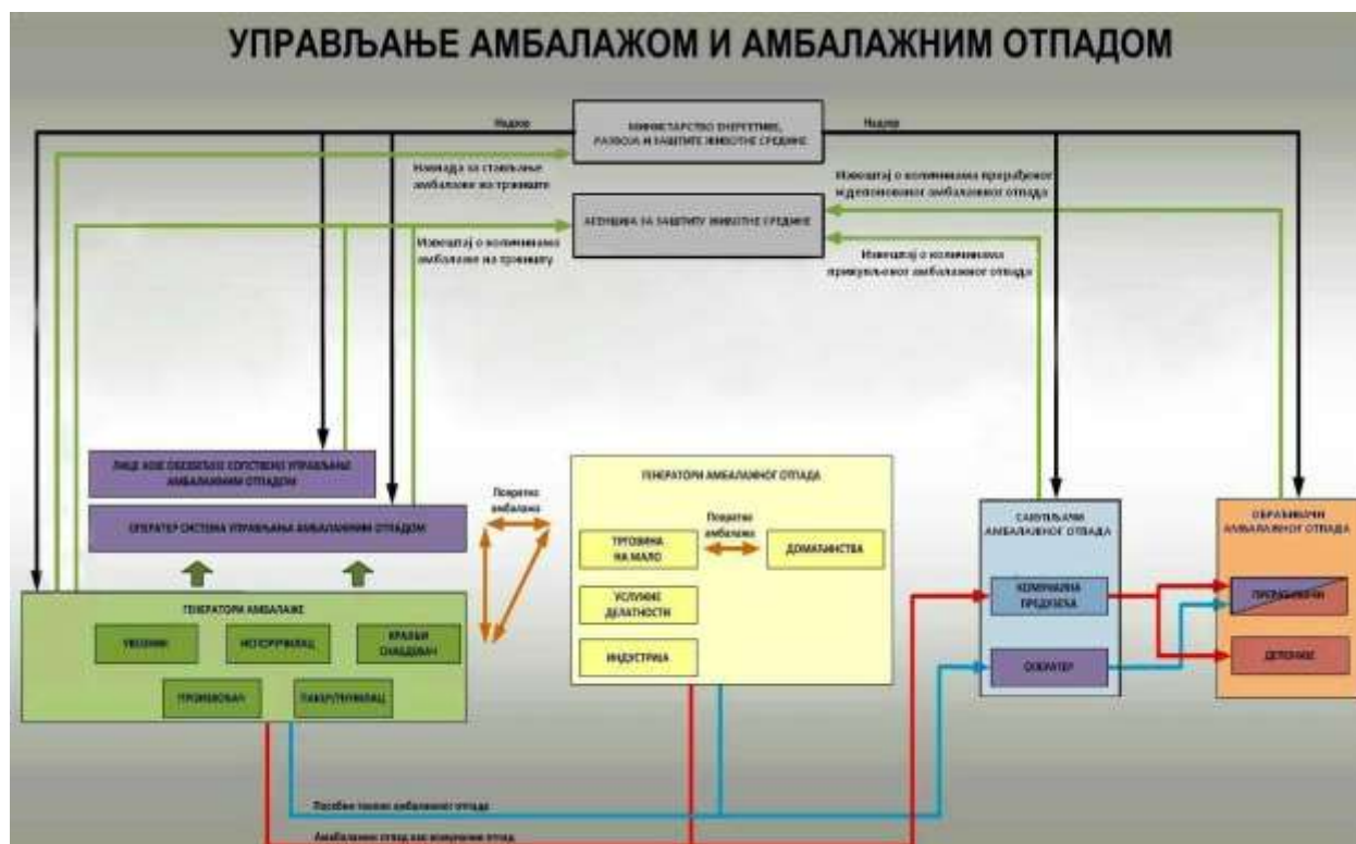
Слика 2. Систем управљања амбалажом и амбалажним отпадом у складу са Законом

Управљање амбалажом и амбалажним отпадом је дефинисано Законом о амбалажи и амбалажном отпаду („Службени гласник РС“, бр. 36/09, 95/2018-др. закон) у даљем тексту - Закон. Предузећа која производе или управљају амбалажом и амбалажним отпадом имају обавезу да у свом раду поступају у складу са одредбама овог Закона и одговарајућим подзаконским актима, и о томе достављају годишње извештаје надлежним органима. Систем управљања амбалажом и амбалажним отпадом у складу са Законом је представљен на слици 2.