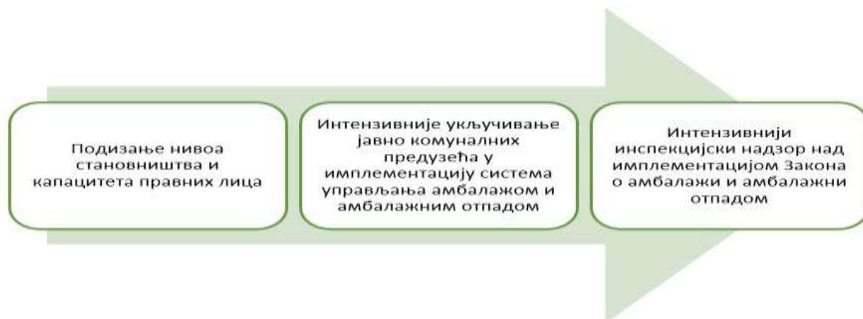
Слика 6. Будуће активности

У циљу достизања националних циљева у 2025. години који у складу са табелом 1, поред општих, обухвата и специфичне националне циљеве за сваку врсту амбалаже потребно је наставити са радом на активностима које за циљ имају: