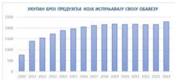
Слика 4. Укупан број предузећа која испуњавају своју обавезу достављања података Агенцији

На слици 4. је дат преглед укупног броја предузећа која испуњавају своју обавезу достављања података Агенцији, док је на слици 5. приказан упоредни приказ предузећа која испуњавају своју обавезу.