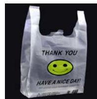
Слика. Биоразградива кеса 3

Извештаје о другим пластичним кесама са адитивима у количини од 2688,18 тона које су пласиране на тржиште Републике Србије, Агенцији за заштиту животне средине, кроз информациони систем Националног регистра извора загађивања до 08. јула 2024. године унело је 33 обвезник извештавања.