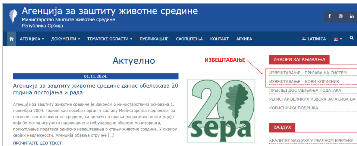
Слика 2. Приказ сајта Агенције за заштиту животне средине приликом извештавања 1