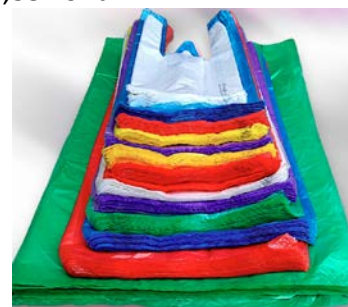
Слика 3. Пластичне кесе без адитива 2

Кроз информациони систем Националног регистра извора загађивања до 08. јула 2024. године унело је 46 обвезника извештавања у количини од 265,35 тона.