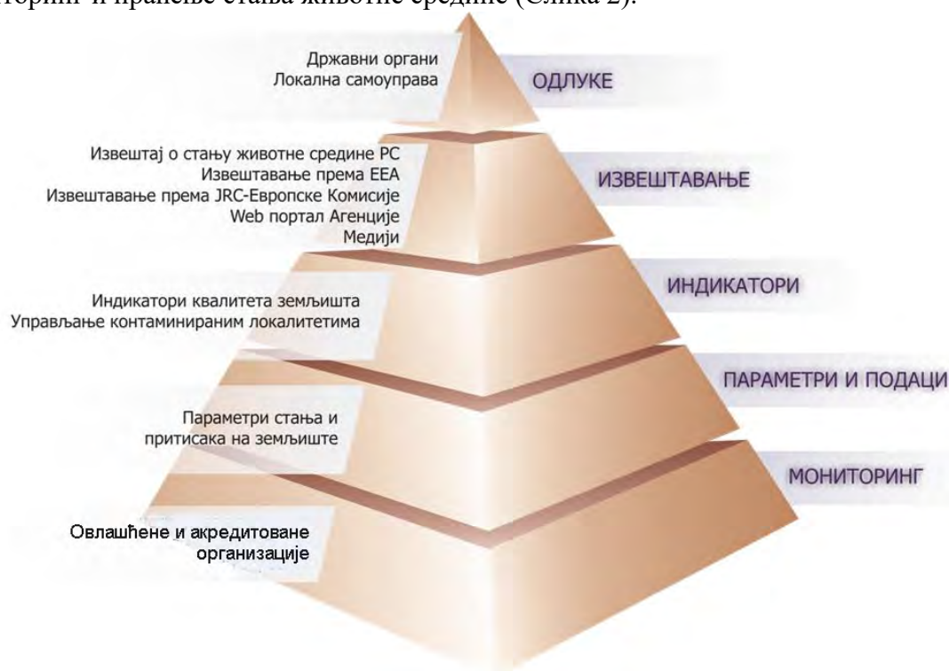
СЛИКА 2. МОДЕЛ ИЗВЕШТАВАЊА О СТАЊУ ЗЕМЉИШТА

Имајући у виду горе наведену Уредбу као и подзаконске акте који су из ње проистекли, структура извештавања о стању земљишта у Републици Србији је адекватно прилагођена кроз приказ информационе пирамиде. Ова пирамида приказује ток креирања политике заштите земљишта, почевши од мониторинга стања, преко прикупљања одговарајућих параметара и података , ради израде индикатора стања, који се затим користе за извештавање о стању земљишта, односно информисање доносилаца одлука . Овакав приказ је заправо основа за будући интегрални систем за мониторинг и праћење стања животне средине (Слика 2).