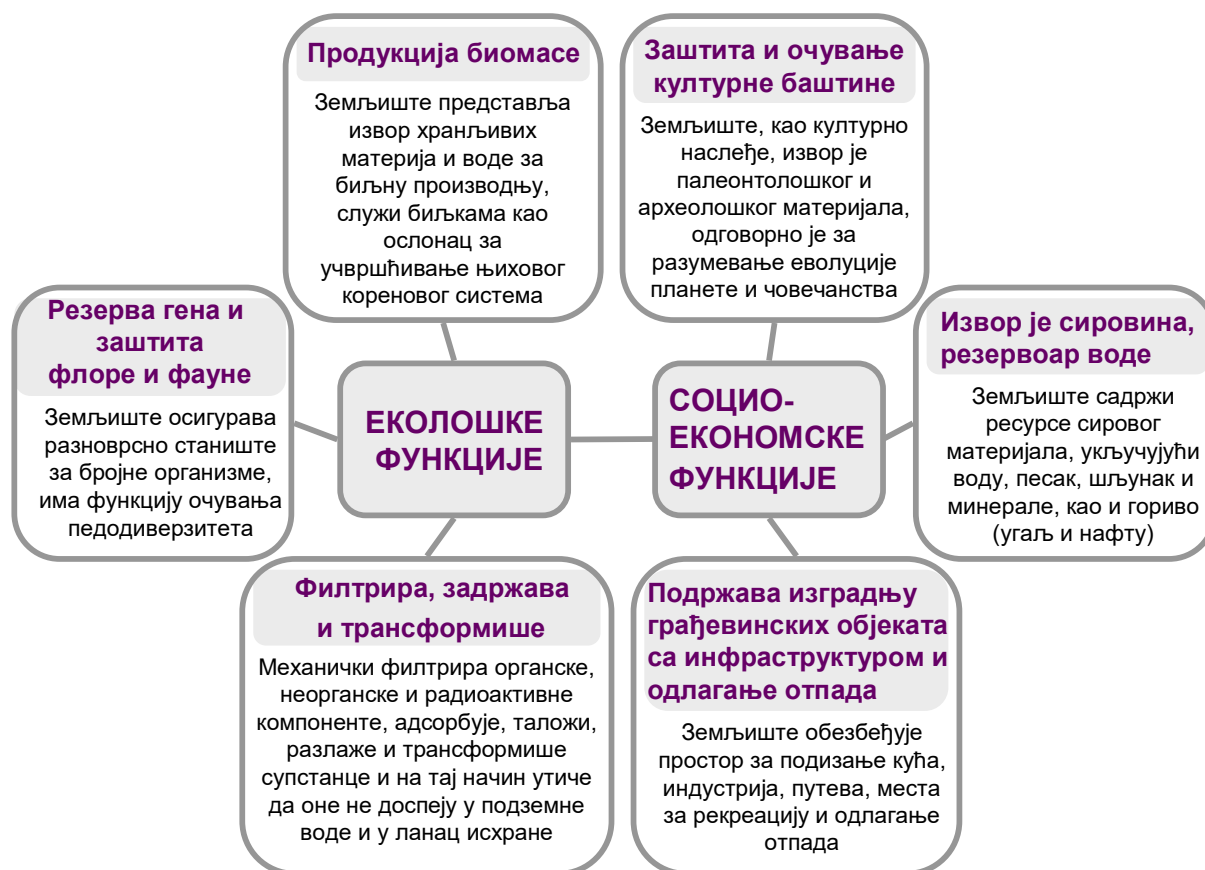
СЛИКА 1. ФУНКЦИЈЕ ЗЕМЉИШТА (ИЗВЕШТАЈ О СТАЊУ ЗЕМЉИШТА, 2009)

Земљиште се одликује плодношћу, односно присуством супстанци (воде, минералних и органских материја, кисеоника) које су неопходне за раст и развиће биљака. Омогућујући примарну продукцију у терестричним екосистемима, земљиште обезбеђује око 90% хране за човечанство и представља услов опстанка живог света на земљи. Из тог разлога неопходно је одржавати његове функције и квалитет (Слика 1).