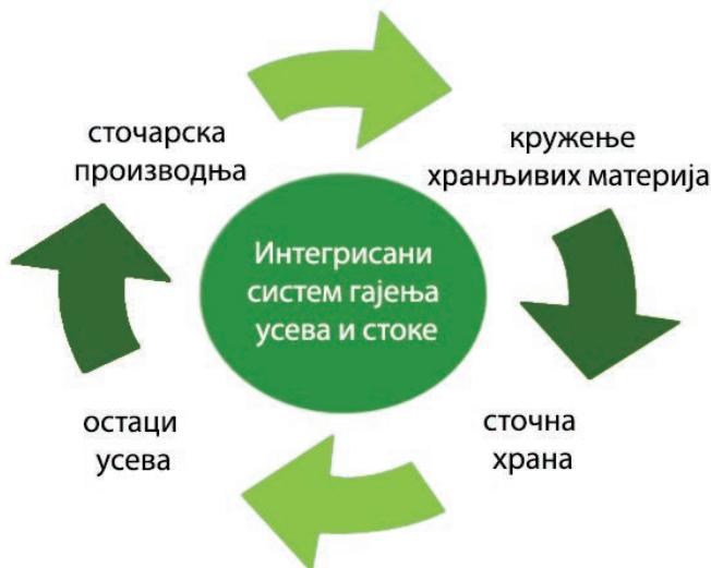
Слика 6: Интегрисани систем гајења усева и стоке

Повећан притисак на земљиште и повећана потражња за сточним производима захтевају ефикасну употребу сточне хране, укључујући остатке усева. Интегрисани систем гајења састоји се од низа пракси које чувају ресурсе, чији је циљ да се достигне одговарајући профит, те висок и одржив ниво производње, уз смањење негативних ефеката интензивног гајења, као и очување животне средине.