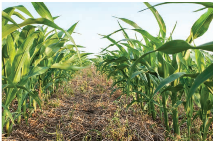
Слика 4: Пример узгајивачког система без примене орања земљишта