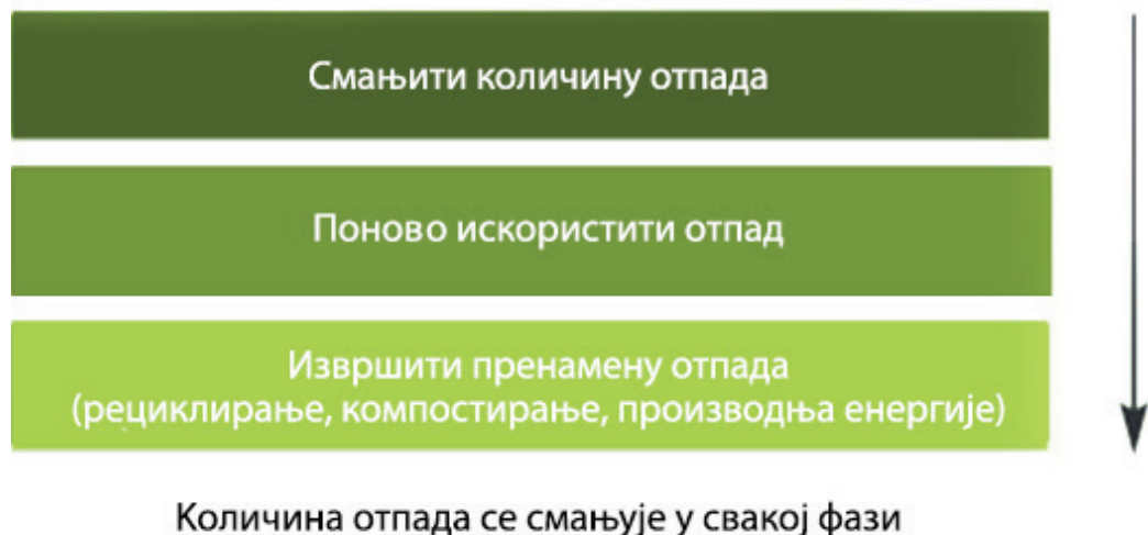
Слика 10: Хијерархија управљања отпадом

Слика 10 приказује редослед по којем треба управљати отпадом. Из ове хијерархије је видљиво да најпре треба смањити количину отпада која се ствара, затим тај отпад поновно искористити, а онда извршити пренамену отпада (рециклирањем, компостирањем или претварањем отпада у енергију) и коначно, као последњу опцију, одложити отпад на депонију.