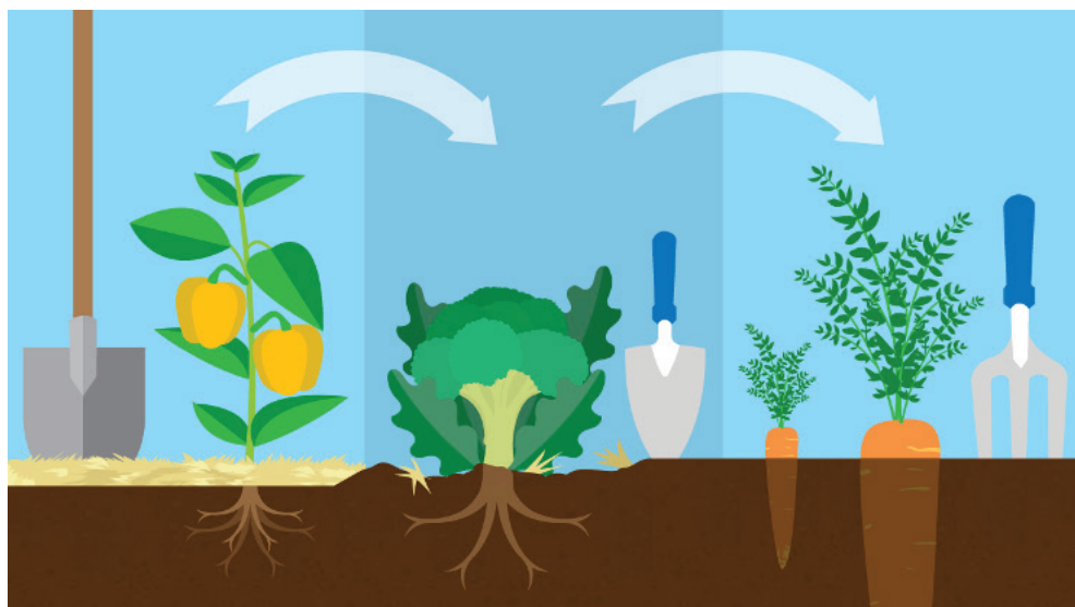
Слика 5: Диверзификације биљака током три године

Конзервацијска пољопривреда омогућава пољопривредницима да смање трошкове производње, утрошено време и рад, поготово у оном периоду када су захтеви високи, нпр. у периоду припреме земљишта и сетве. Поред тога, смањени су трошкови улагања и одржавања машина уколико се ради о механизованом систему. Краткорочно гледано, мане оваквог приступа могу бити пре свега високи почетни трошкови, за набавку опреме, промена режима рада, као и потреба за додатном едукацијом. 37