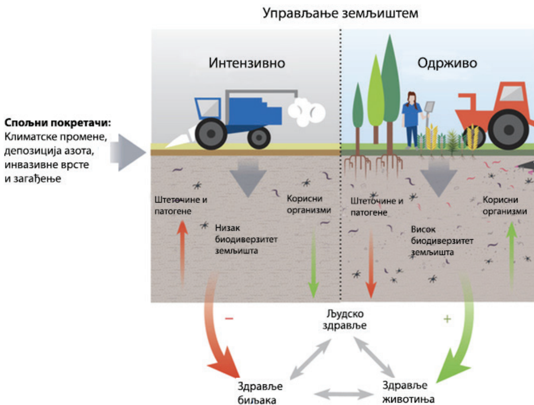
Слика 1: Приказ утицаја различитих пракси коришћења земљишта на биодиверзитет земљишта

Специфичне групе организама могу бити подложније, тј. осетљивије нас поједине загађиваче или различите притиске од других. На пример, азотофиксирајуће бактерије ( Rhizobium sp.), које живе у симбиози с биљкама легуминозама, нарочито су осетљиве на присуство бакра; колоније мрва не могу да се одупру честој обради земљишта је оне нарушавају њихова гнезда, док су, уопштено, земљишне гриње веома снажна, отпорна група организама. Ово често негативно утиче на примарну сврху коришћења земљишта – производњу довољних количина здравствено безбедне хране за животиње и човека.