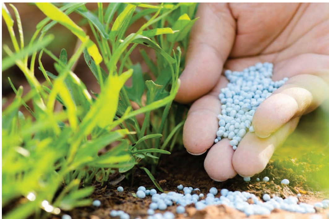
Слика 3: Примери интегрисаног управљања плодношћу земљишта (компостирање, примена ђубрива и малчирање)