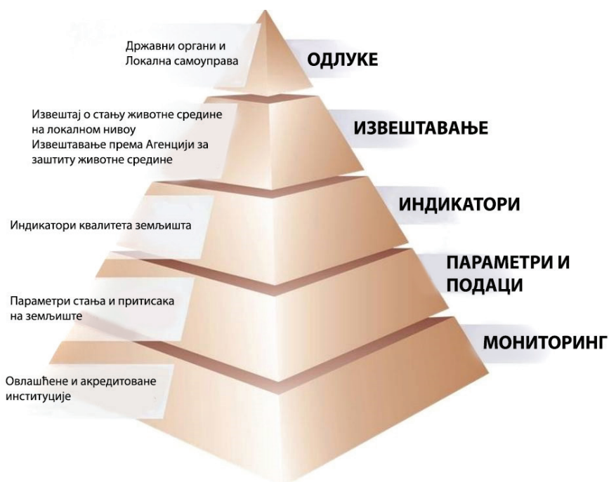
Слика 13: Структура управљања земљиштем на локалном нивоу

Структура управљања земљишним ресурсима и извештавање о стању земљишта на локалном нивоу адекватно је прилагођено кроз приказ информационе пирамиде (Слика 13 Структура управљања земљиштем на локалном нивоу). Ова пирамида приказује ток стварања политике заштите земљишта, почевши од мониторинга стања, преко прикупљања одговарајућих параметара и података ради израде индикатора стања, који се затим користе за извештавање о стању земљишта, односно информисање доносилаца одлука . Овакав приступ заправо је основа за интегрални систем мониторинга стања земљишта и његовог одрживог коришћења (Слика 13).