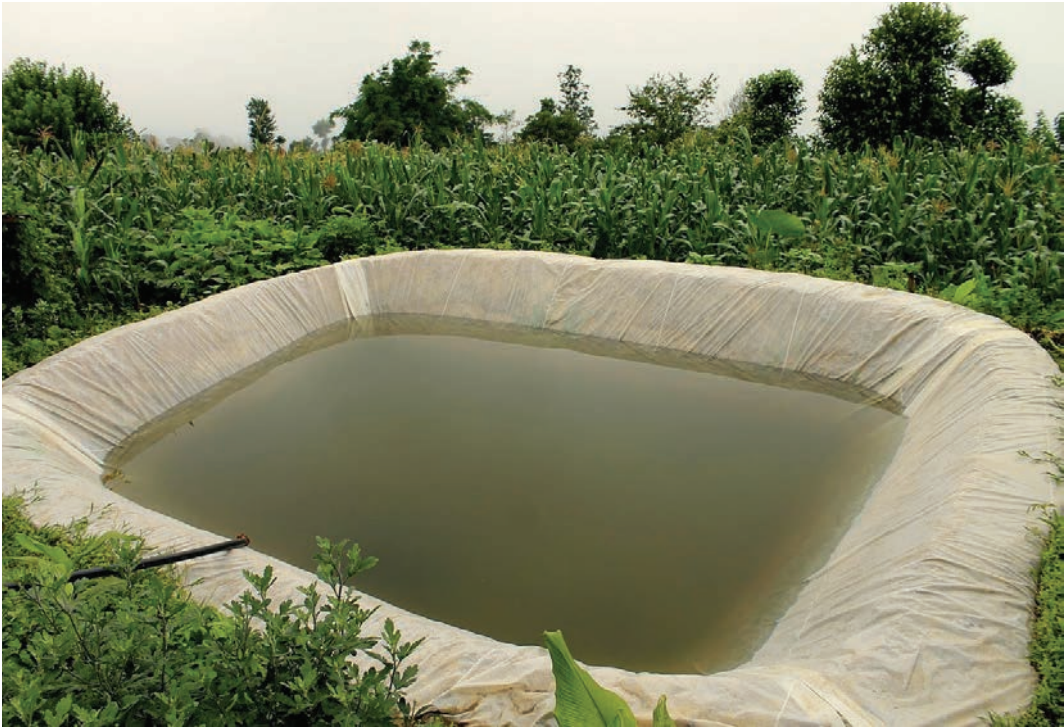
Слика 9: Сакупљање кишнице на југу Кине