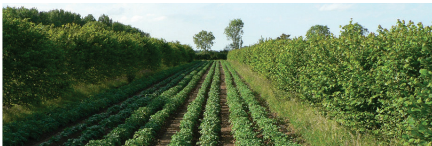
Слика 7: Пример агрошумарства

Агрошумарство је збирно име за системе и праксе коришћења земљишта у којима су вишегодишње дрвенасте биљне врсте плански интегрисане с пољопривредним културама и/или стоком за низ користи и услуга (WOCAT, 2011). Обухвата технологије које се примењују у шумарству и пољопривреди зарад повећања продуктивности, економске оправданости, еколошке прихватљивости и одрживог коришћења земљишта. Може варирати од врло једноставних и ретких до веома комплексних и згуснутих система. Агрошумарство обухвата концепт интеграције шумских површина, у комбинацији са обрадивим земљиштем и пашњацима, како би се постигла мултифункционалност. Не постоји јасна граница између агрошумарства и шумарства, нити између агрошумарства и пољопривреде. Системи агрошумарства имају одличан потенцијал за диверзификацију хране и извора прихода, побољшање продуктивности земљишта, те потенцијал да зауставе и преокрену деградацију земљишта, како би се формирали повољни микроклиматски услови, трајни покривач земљишта, повећао се садржај органског угљеника, побољшала структура земљишта, инфилтрација воде, плодност и биолошка активност. (WOCAT, 2011; FAO, 2016).