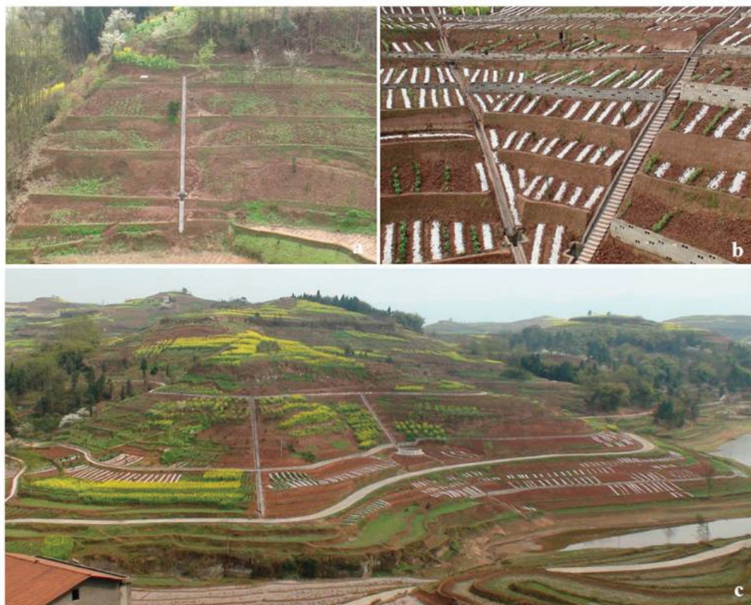
Слика 8: Системи контурне обраде земљишта на падинама

Системи контурне обраде земљишта на падинама су мере које се предузимају на нагнутим теренима у облику земљаних насипа или камених сложаја, узаних појасева одабраних врста трава и дрвећа, с циљем да се формирају терасе чије су функције: смањење брзине кретања воде, редукација површинског отицаја, повећана инфилтрација и ретенција и минимизирање интензитета ерозије, што доприноси очувању физичке структуре земљишта и његових производних својстава. Пожељно је формирање тераса с контранагибом у односу на доминантан нагиб терена.