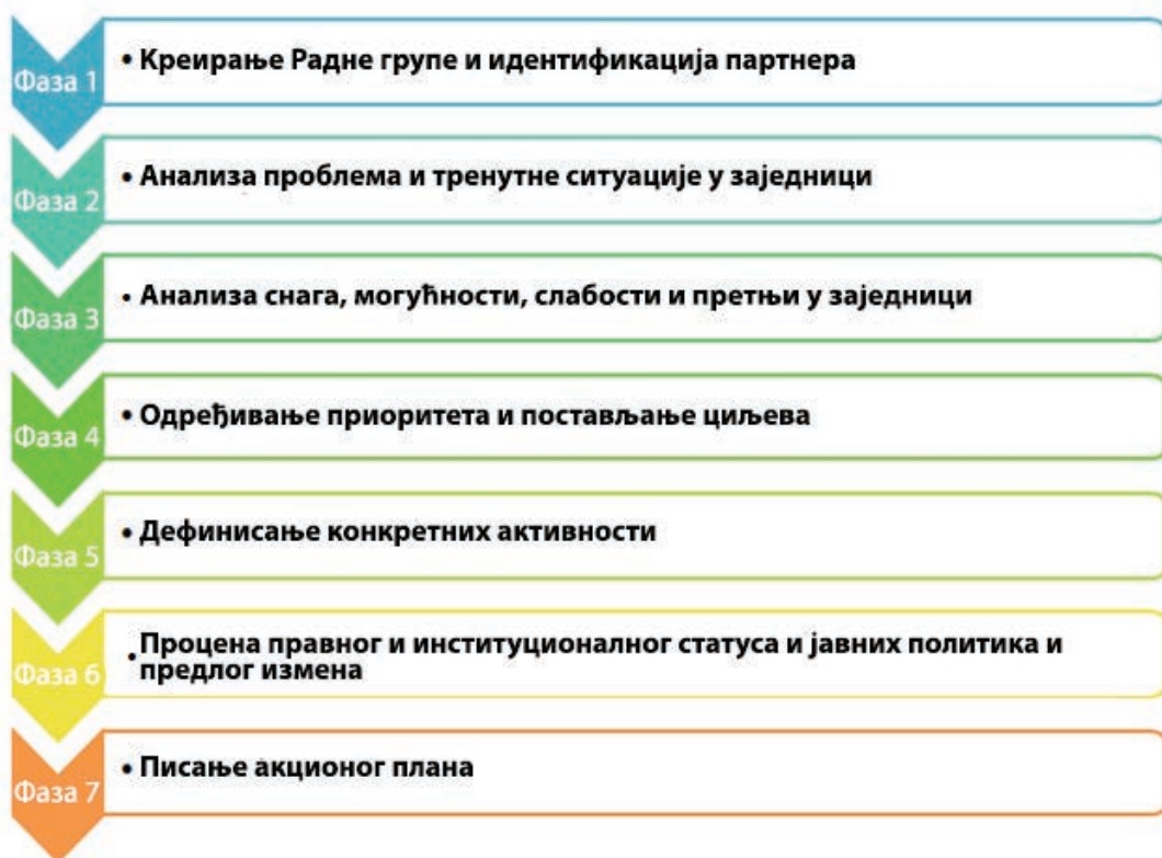
Слика 11: Фазе у процесу прављења Акционог плана

У трећој фази се анализирају снага и слабости (могу бити политичке, правне, институционалне, економске, финансијске, научне, технолошке, друштвене, културолошке) претњи у локалној заједници (нпр. прекомерна испаша на пашњацима, незаконита сеча шума и сл.) и прилика – најраширеније коришћена метода је SWOT (енгл.: Strengths, Weaknesses, Opportunities, Threats). Након прве три фазе, следи четврта фаза у којој се постављају приоритети важни за локалну заједницу и постављају се циљеви (ако нису већ раније донесени у стратешко-планским документима, погледати поглавље 6.2 Планирање и интегрисање одрживог управљања земљиштем). У петој фази дефинишу се конкретне активности и расподељују се одговорности. У фази 6 врши се процена правног и институционалног статуса и јавних политика у области управљања земљиштем, и смишља се предлог неопходних измена важних за имплементацију акционог плана, али и за општи напредак у одрживом управљању земљиштем. Фаза 7 подразумева сумирање свих прикупљених информација у један документ, за који би било пожељно да садржи и финансијску конструкцију у вези с предложеним активностима.