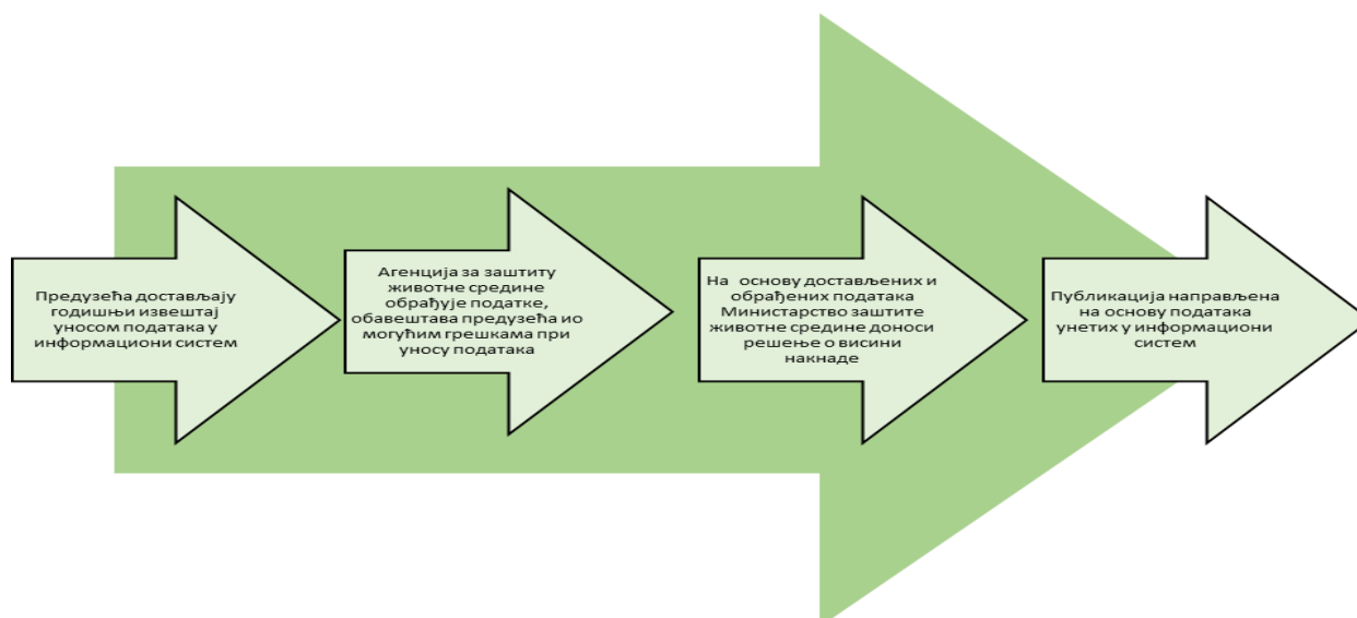
Слика 1. Ток достављања и обраде података

Пресек података за извештајну 2021. годину рађен је у јулу 2022. године.