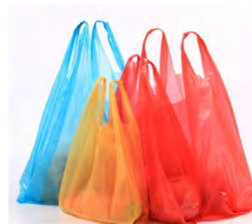
Слика 3. Пластичне кесе без адитива 2

Агенцији је извештаје за ову врсту кеса у количини од 91,11 тона, стављених на тржиште Републике Србије доставило 53 предузећа до 11. јула 2022. године.