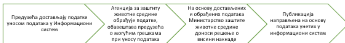
Слика 1. Ток достављања и обраде података

НАПОМЕНА: Публикација је рађена искључиво на основу података унетих од стране корисника у информациони систем Агенције за заштиту животне средине.