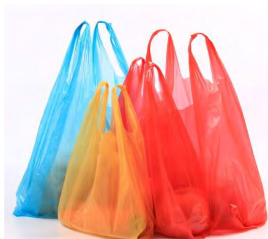
2 Слика 2.

Агенцији је извештаје за ову врсту кеса у количини од 390,55 тона, стављених на тржиште Републике Србије послало 39 предузећа.