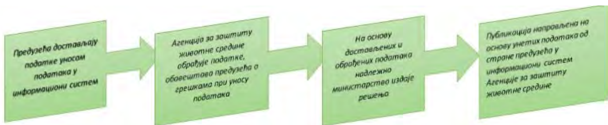
Слика 1. Ток достављања и обраде података

НАПОМЕНА: Публикација је рађена искључиво на основу података унетих од стране корисника у информациони систем Агенције за заштиту животне средине.