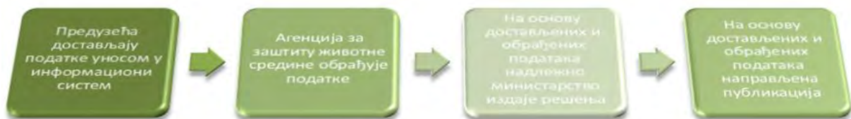
Слика 1. Ток достављања и обраде података

НАПОМЕНА: Публикација је рађена искључиво на основу података унетих од стране корисника у информациони систем Агенције за заштиту животне средине.