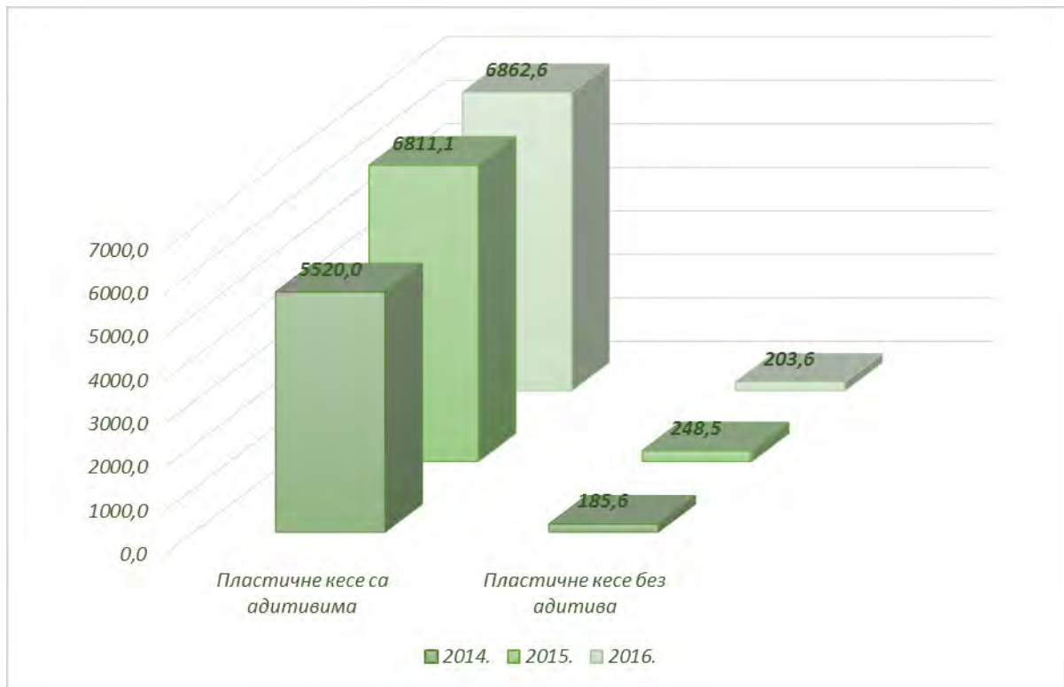
Слика 1. Упоредни приказ о пласираним кесама на тржиште Републике Србије за период 2014.-2016.