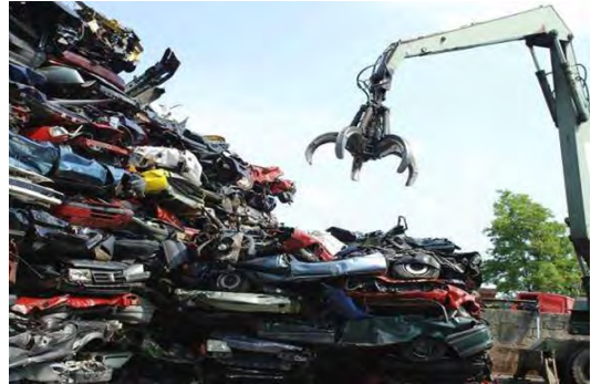
11 Слика број 13

Оператери за поновно искоришћење отпада су известили Агенцију да су третирали 2548 t ове врсте отпада.