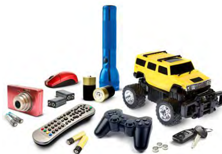
4 Слика број 6

Подаци о врсти и количини акумулатора и батерија који су стављени на тржиште Републике Србије у 2018. години приказани су у табели 2.