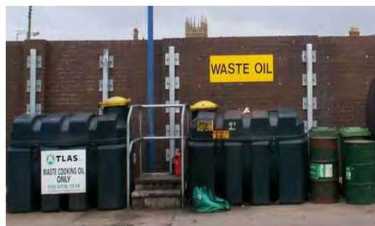
7 Слика број 9

Према извештајима извозника ове врсте отпада извезено је 186 t отпадног уља.