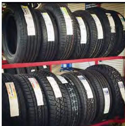
1 Слика број 3

Подаци о врсти и количини производа који спадају у ову категорију посебних токова отпада који су стављени на тржиште Републике Србије у 2017. години приказани су у табели број 1.