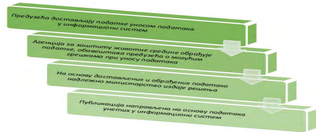
Слика 2. Ток достављања и обраде података

На основу свега изнетог можемо да закључимо: