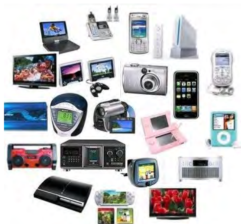
8 Слика број 10

Подаци о врсти и количини производа који спадају у ову категорију посебних токова отпада који су стављени на тржиште Републике Србије у 2018. години приказани су у табели број 4.