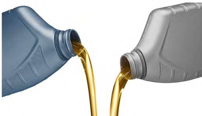
6 Слика број 8

Подаци о врсти и количини производа који спадају у ову категорију који су стављени на тржиште Републике Србије у 2018. години приказани су у табели 3.