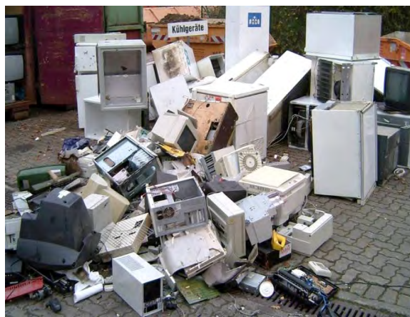
9 Слика број 11

У 2018. години је по пристиглим подацима, одложено 11 t. У истом периоду прерађено је 32615 t отпада. Ову врсту отпада претежно чини одбачена опрема и компоненте уклоњене из одбачене опреме.