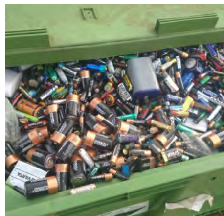
5 Слика број 7

На основу годишњег извештаја о прекограничном кретању отпада извезено је 5826 t ове врсте отпада, а у истом периоду увезено је 996 t.