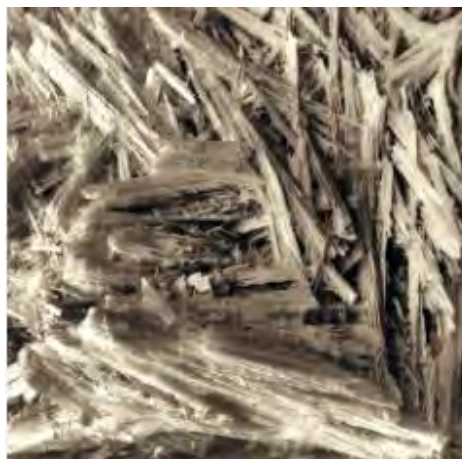
3 Слика број 5

Према достављеним подацима оператера који имају дозволу за одлагање ове врсте отпада одложено је 246 t отпада који је сачињен од грађевинских и изолационих материјала који садрже азбест и припадају групи 17 према Каталогу отпада.