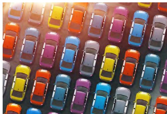
10 Слика број 12

Подаци о врсти и количини производа који спадају у ову категорију посебних токова отпада који су стављени на тржиште Републике Србије у 2018. години приказани су у табели број 5.