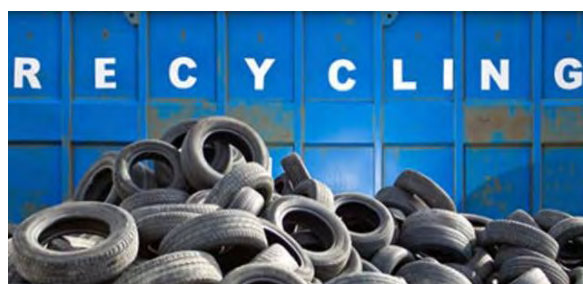
2 Слика број 4

На основу достављених образаца за увоз отпада, у 2018. години увезено је 180 t ове врсте отпада. У истом периоду је одложено 177 t ове врсте отпада