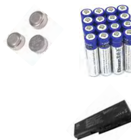
Табела 2. Количина акумулатора и батерија стављених на тржиште у 2016. години

Агенцији је извештаје о производима ове врсте стављеним на тржиште Републике Србије доставило је 1904 предузећа. Подаци о врсти и количини акумулатора и батерија који су стављени на тржиште Републике Србије у 2016. години приказани су у табели 2.