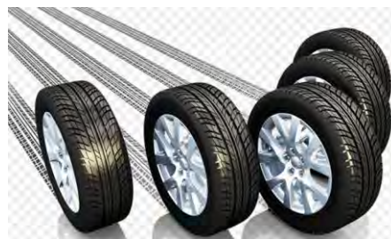
Табела 1 . Количина гума стављених на тржиште у 2016. години

Подаци о врсти и количини производа који спадају у ову категорију посебних токова отпада који су стављени на тржиште Републике Србије у 2016. години приказани су у табели број 1.