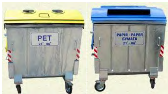
Slika7. Simboličan prikaz planiranih kontejnera za sakupljanje PET-a i papira