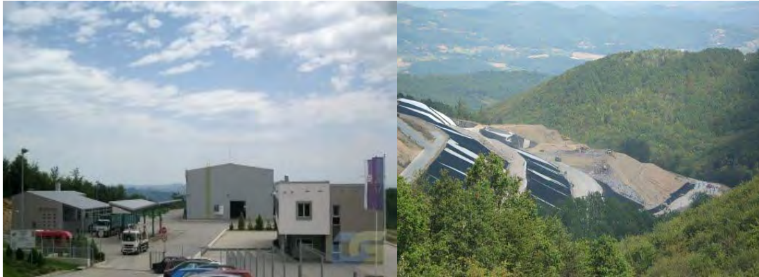
Slika H. Regionalna deponija “ Duboko” ( postrojenje za preradu otpada levo i telo deponije desno)

Pored navedenih objekata sanitarna deponija “Duboko” ima i prateće objekte, a to su transfer stanice koje će biti izgrađene u svim opštinama osim u opštini Užice.