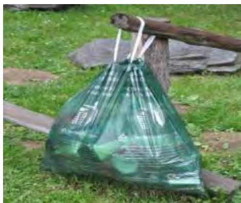
Slika 8. Simboličan prikaz kesa za suvo sakupljanje PET ambalaže i drugih vrsta materijala

Od ostale opreme, JKP „Komunalno“ poseduje mehanizaciju i vozila za sakupljanje otpada, shodno navedenom u poglavlju 4.3., kao i jednu presu za baliranje.