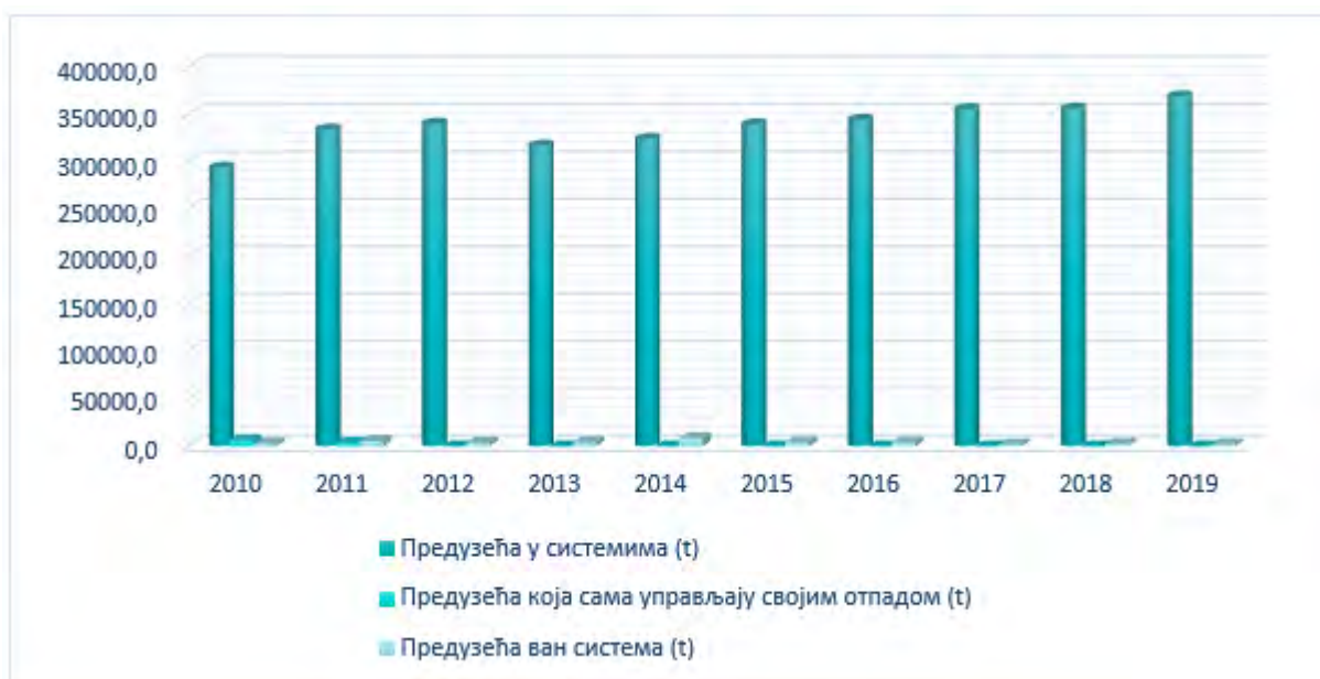
Слика 6. Количина амбалаже стављена на тржиште Републике Србије

* Предузеће са дозволом за самостално управљање амбалажним отпадом пренело своје обавезе на националне оператере.