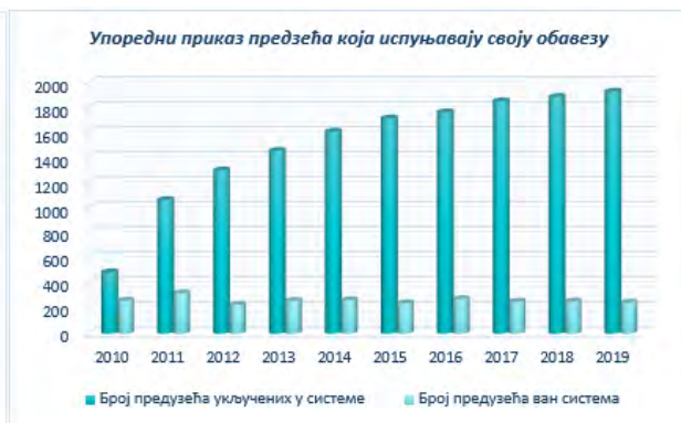
Слика 5. Упоредни приказ предузећа која испуњавају своју обавезу.

Анализом достављених података о количинама амбалаже пласиране на тржиште Републике Србије може се закључити: