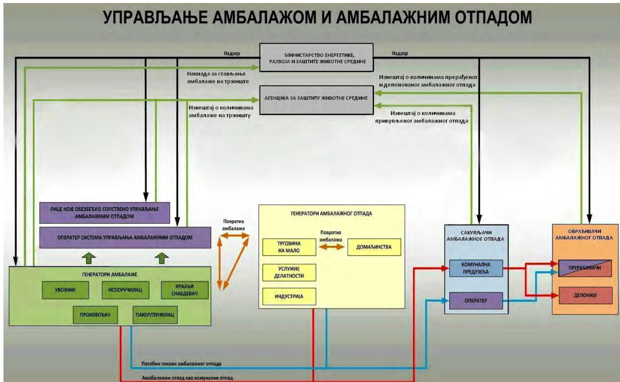
Слика 2. Систем управљања амбалажом и амбалажним отпадом у складу са Законом

Управљање амбалажом и амбалажним отпадом је дефинисано Законом о амбалажи и амбалажном отпаду („Службени гласник РС“, бр. 36/09, 95/2018-др. закон) у даљем тексту - Закон. Предузећа која производе или управљају амбалажом и амбалажним отпадом имају обавезу да у свом раду поступају у складу са одредбама овог Закона и одговарајућим подзаконским актима, и о томе достављају годишње извештаје надлежним органима. Систем управљања амбалажом и амбалажним отпадом у складу са Законом је представљен на слици 2.