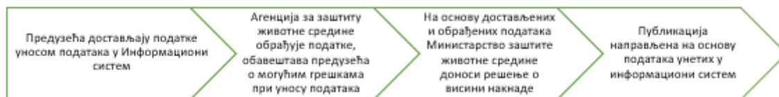
Слика 1. Ток достављања и обраде података

У циљу достизања националних циљева и у 2020. години, као и у претходном периоду потребно је и даље радити на подизању нивоа свести становништва и капацитета правних лица, још интензивнијем укључивању јавно комуналних предузећа у имплементацију система управљања амбалажом и амбалажним отпадом, као и појачати инспекцијски надзор предузећа.