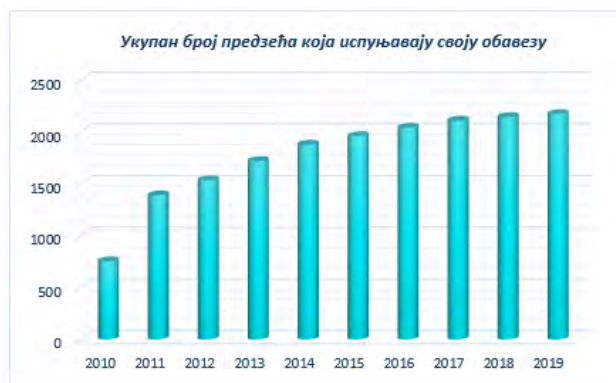
Слика 4. Укупан број предузећа која испуњавају своју обавезу достављања података Агенцији

На слици 4 је дат преглед укупног броја предузећа која испуњавају своју обавезу достављања података Агенцији, док је на слици 5. приказан упоредни приказ предузећа која испуњавају своју обавезу.