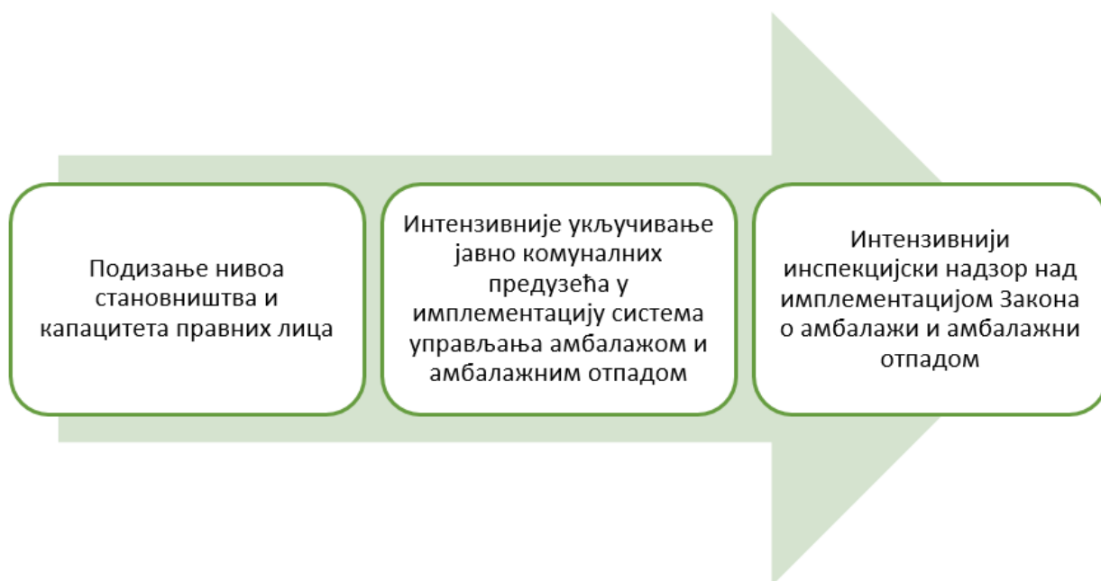
Слика 7. Будуће активности

У циљу достизања националних циљева у 2020. години који у складу са табелом 1, поред општих, обухвата и специфичне националне циљеве за сваку врсту амбалаже потребно је наставити са радом на активностима које за циљ имају: