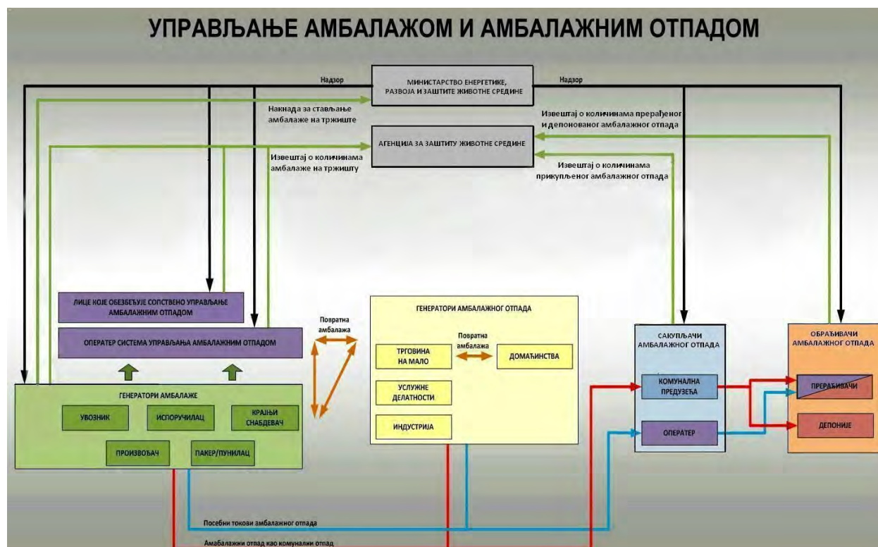
Слика 1. Систем управљања амбалажом и амбалажним отпадом у складу са Законом

Управљање амбалажом и амбалажним отпадом је дефинисано Законом о амбалажи и амбалажном отпаду (Сл. гласник РС, бр. 36/09) у даљем тексту - Закон. Предузећа која производе или управљају амбалажом и амбалажним отпадом имају обавезу да у свом раду поступају у складу са одредбама овог Закона и одговарајућим подзаконским актима, и о томе достављају годишње извештаје надлежним органима. Систем управљања амбалажом и амбалажним отпадом у складу са Законом је представљен на слици 2.