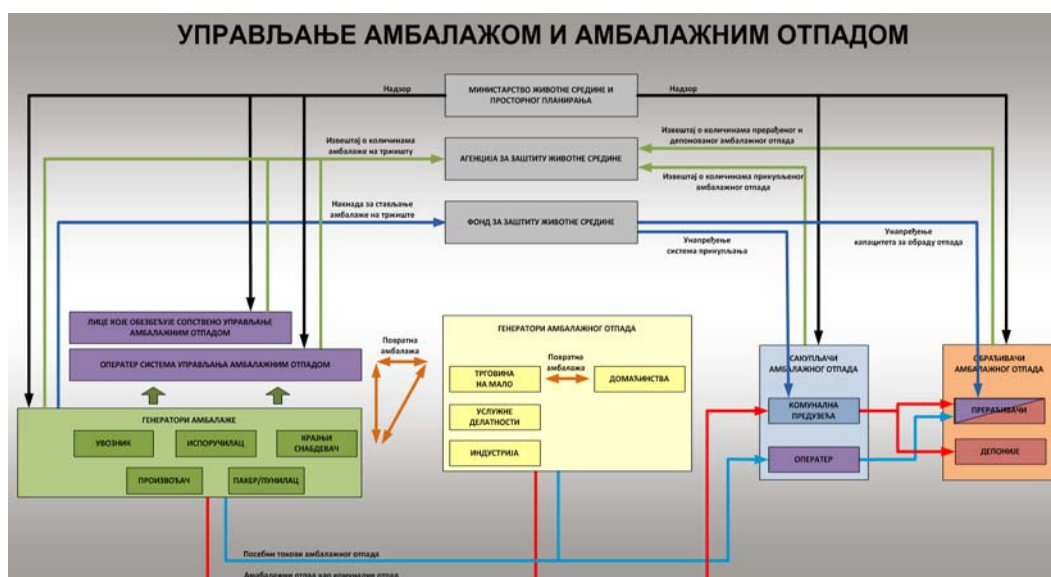
Слика 1. Систем управљања амбалажом и амбалажним отпадом у складу са Законом

Систем управљања амбалажом и амбалажним отпадом у складу са Законом је представљен на слици 1.