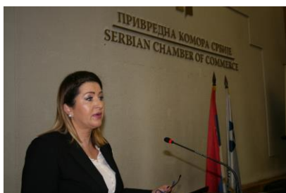
Стана Божовић, Државни секретар Министарства пољопривреде и заштите животне средине